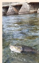
Trucha Río Ebro.

*Los días de pesca con muerte: permitidos, mosca artificial, cucharilla con un anzuelo y señuelos artificiales con un solo anzuelo.