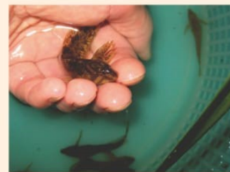
Blenio Río Nela.